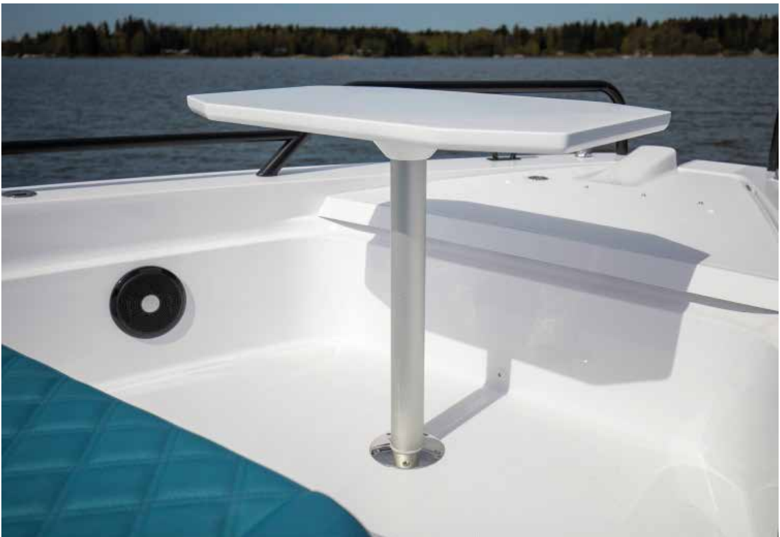
Table sur pont avant, GRP